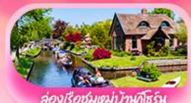
ล่องเรือชมหมู่บ้านทิวริน