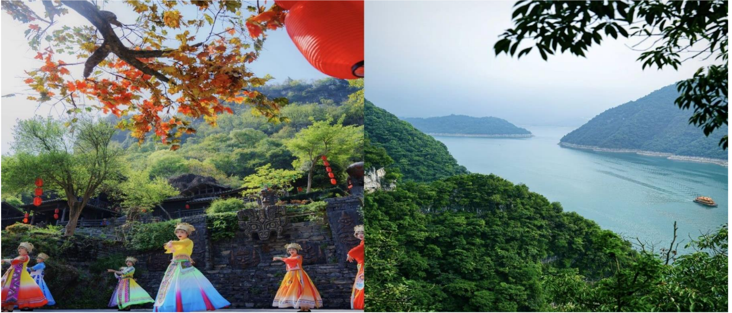
เที่ยว รับประทานอาหารกลางวัน ณ ภัตตาคาร

ID Line: runpornpi / kkt18 / anntour18, E-mail : khunklangtour@gmail.com